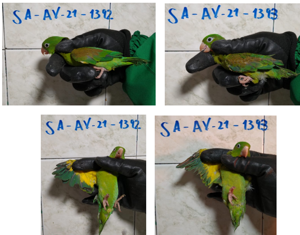
Foto 2. Individuos vivos de Brotogeris jugularis (perico bronceado) No. de rotulo SA-AV-21-1392 y SA-AV-21-1393. Acta Única de Control al tráfico ilegal de flora y fauna silvestre No. 161155.

En el momento de la valoración preliminar del estado de los individuos, se determinó que son ejemplares adulto joven, con estado de salud regular, condición corporal normal, que presentaban mutilación de plumas bilaterales de los miembros superiores y alto nivel de estrés, causado por la temperatura, las horas de viaje y el embalaje en el que fueron movilizados. La dieta suministrada consistía en pan con leche y frutas.